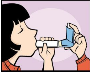
A. Espaciador/Cámara de sostén.